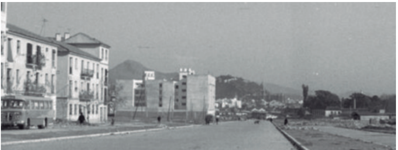
Barrio del Perchel 1965.